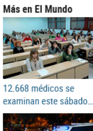
12.668 médicos se examinan este sábado...